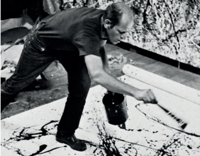
Jackson Pollock (1950): Drip Painting

Qualität des Farbauftrags: Wie sorgfältig ist der Farbauftrag auf das gewählte Verb abgestimmt?